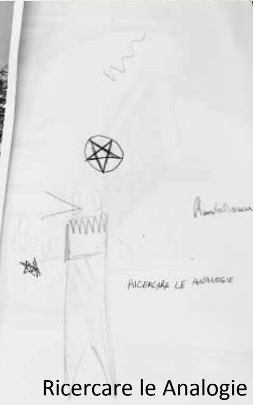
Ricerca le Analogie