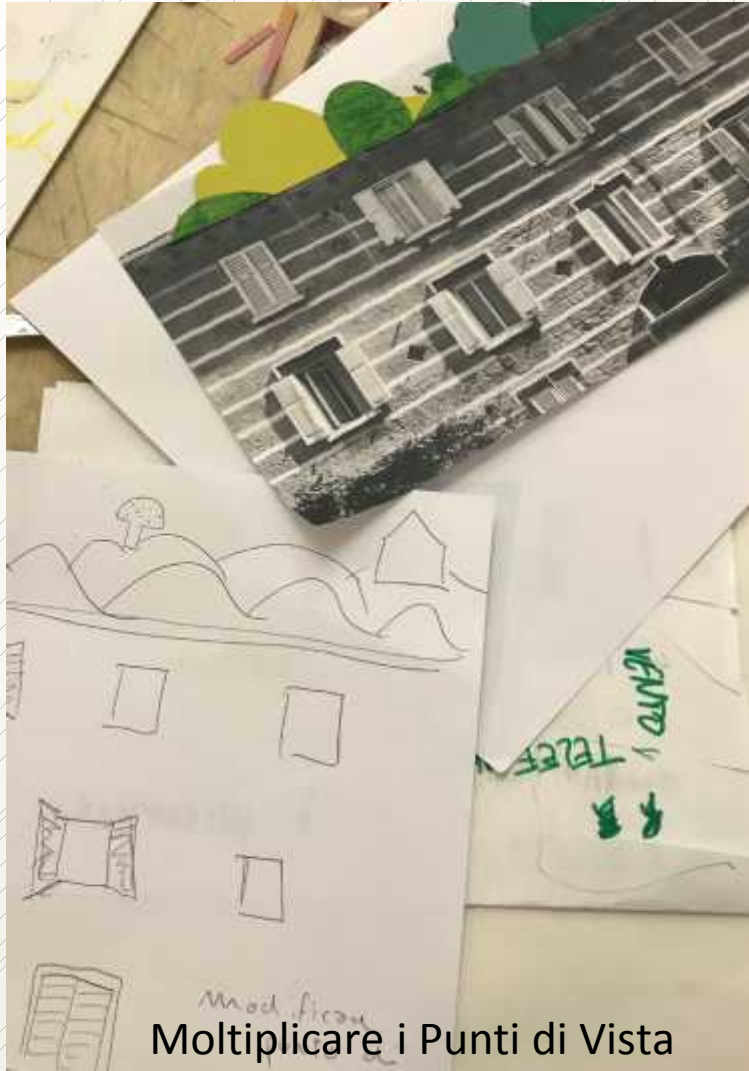
Moltiplicare i Punti di Vista