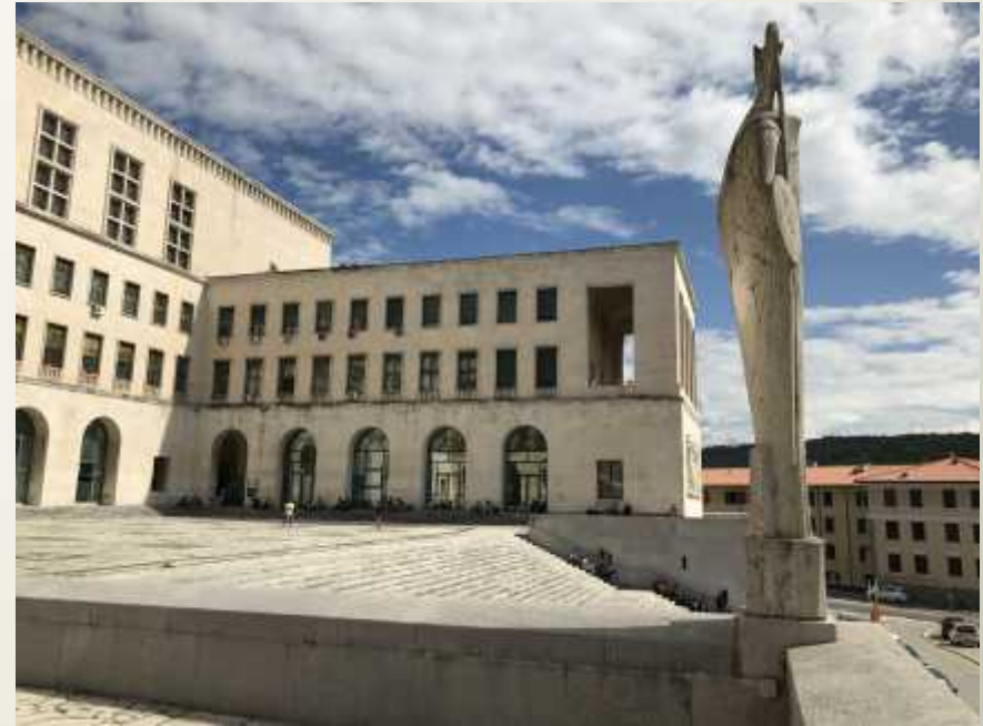
Università, corpo centrale