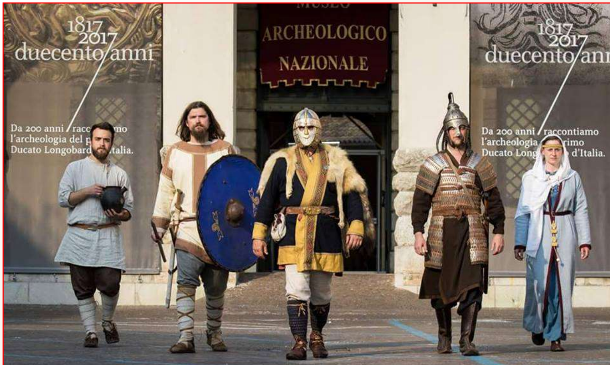
IARS - Incontri di Archeologia e Rievocazione Storica