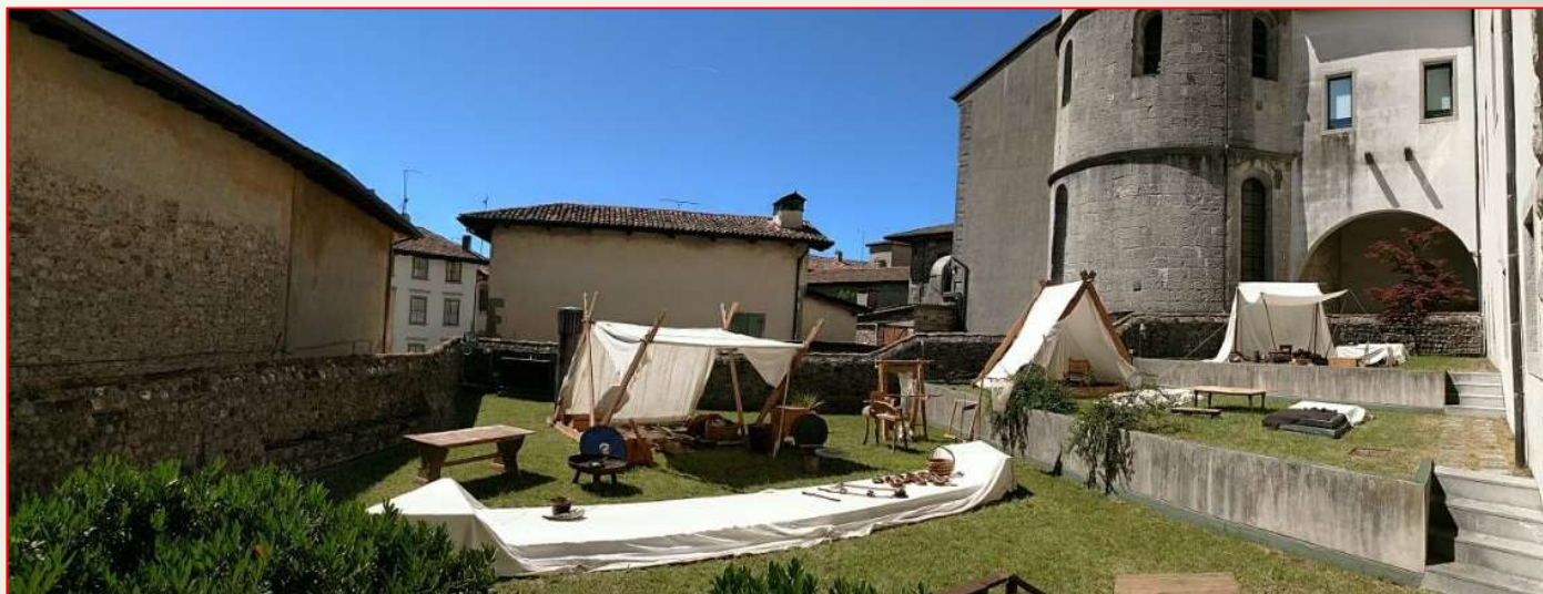
Incontri di innovazione e sperimentazione MAN Cividale